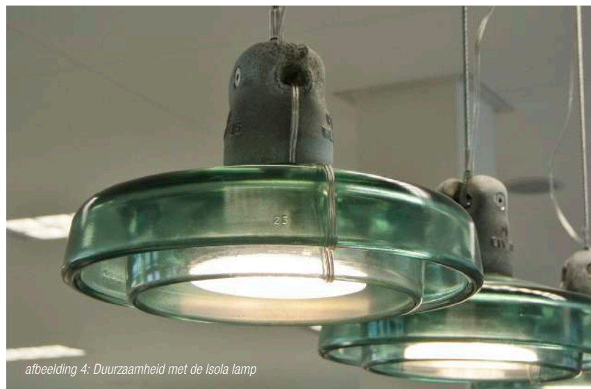
afbeelding 4: Duurzaamheid met de Isola lamp

blemen op het gebied van verlichting en akoestiek op. Twee vliegen in één klap. Een voorbeeld van een multifunctioneel product is de Bowler (afbeelding 3). De combinatie van het fluweelachtige absorptieschuim met zeer hoge akoestische waarden en geïntegreerde professionele lichtunits maakt dit product uitermate geschikt voor lobby's en wachtruimtes. In deze serie zijn bij Arpalight vele variaties voorhanden.