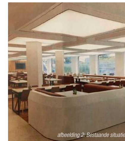
afbeelding 2: Bestaande situatie