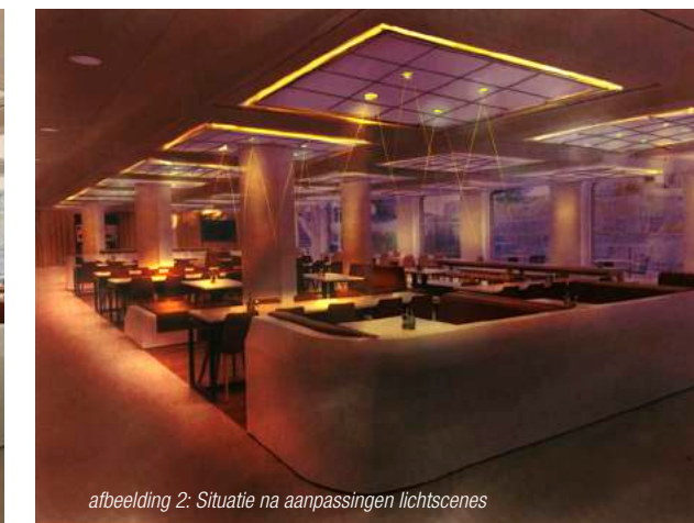
afbeelding 2: Situatie na aanpassingen lichtscènes

In de huidige architectuur wordt vaak gebruik gemaakt van enorme 'loft-achtige' ruimtes. Deze